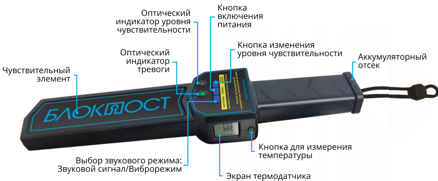
Рисунок 1 – Внешнее описание устройства

Ручной металлодетектор РД 1000 Т предназначен для обнаружения металлических предметов и измерения температуры. Характерные преимущества ручного металлодетектора марки БЛОКПОСТ – точность измерения температуры тела, небольшой размер и вес, высокая чувствительность по обнаружению черных и цветных металлов и функциональность изделия. Металлодетектор используется в местах с высокой проходимостью людей: аэропорты, вокзалы, таможенные службы, медицинские учреждения, государственные и социальные учреждения, заводы, учебные заведения, а также массовые мероприятия.